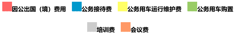
图 3、“三公”经费、培训费、会议费支出预算构成